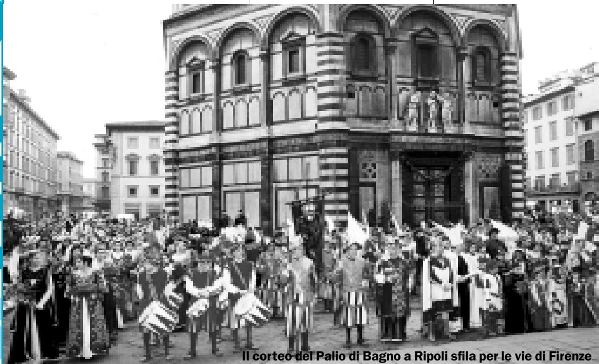
Il corteo del Palio di Bagno a Ripoli sfilava per le vie di Firenze

Comune, uffici chiusi il 14 agosto pag. 2